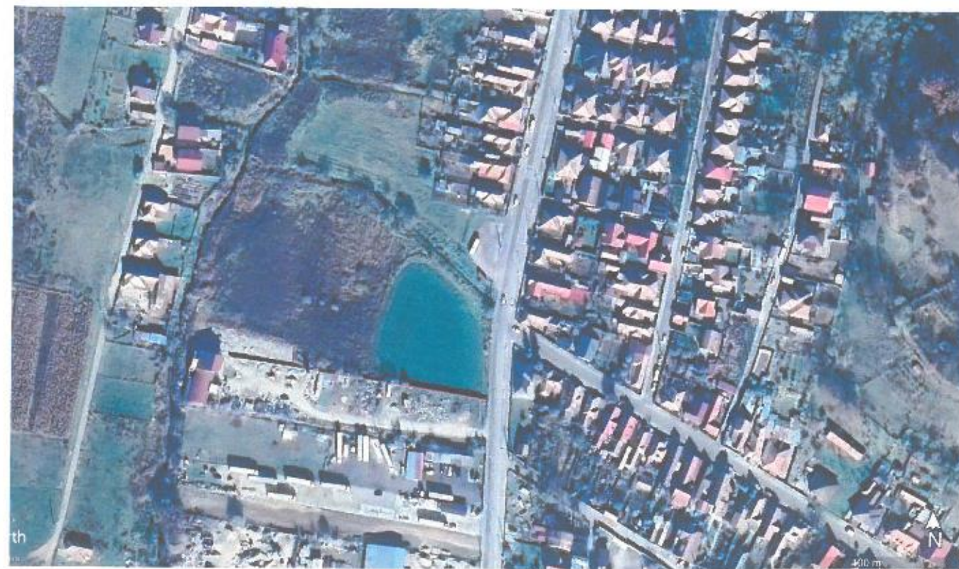
PLAN DE INCADRARE GOOGLE EARTH