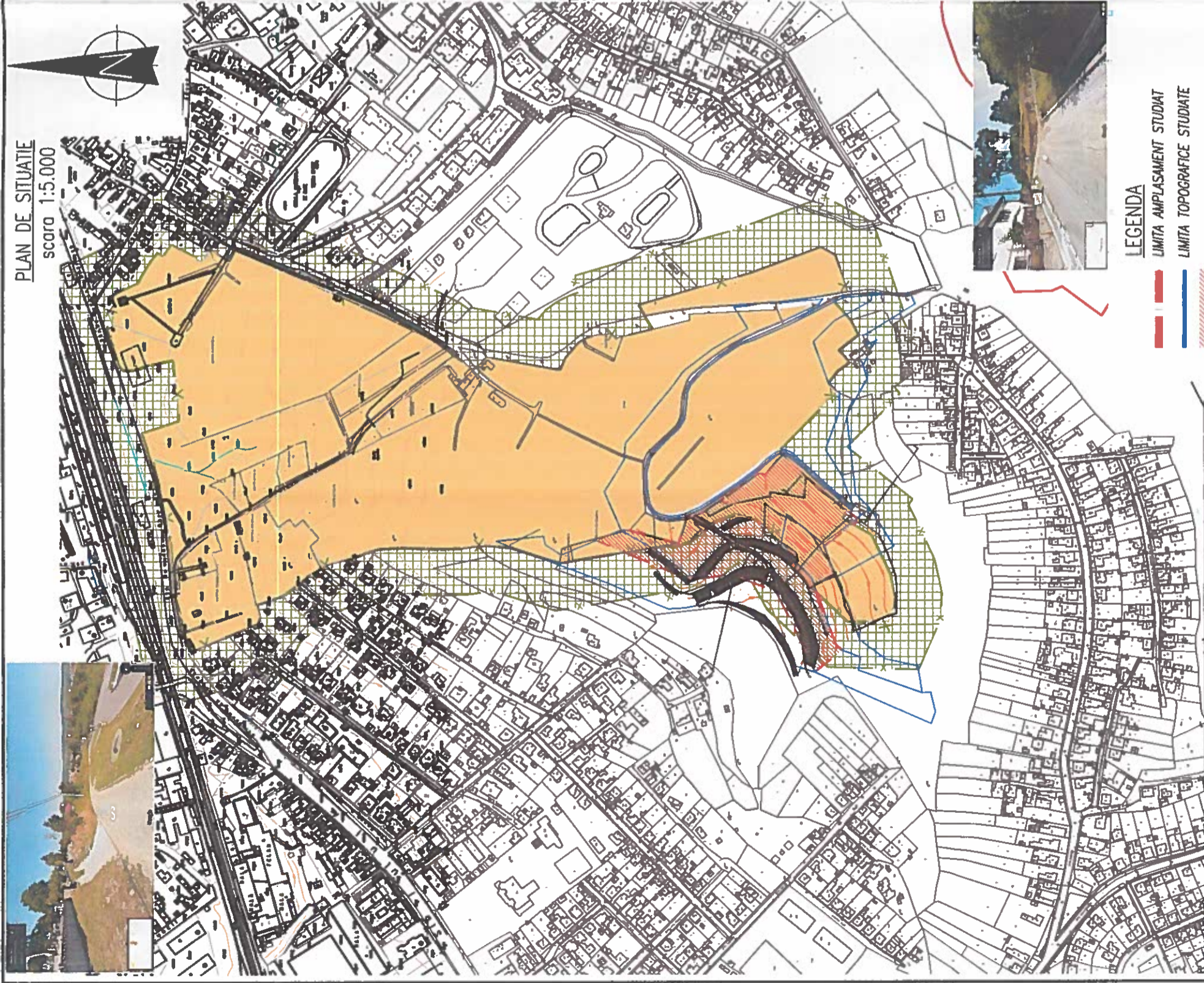
PLAN DE SITUATIE scara 1:5.000