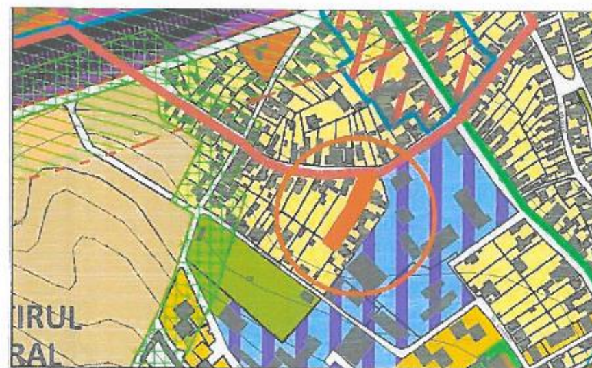
INCADRARE IN P.U.G. MEDIAS Scara 1:5000