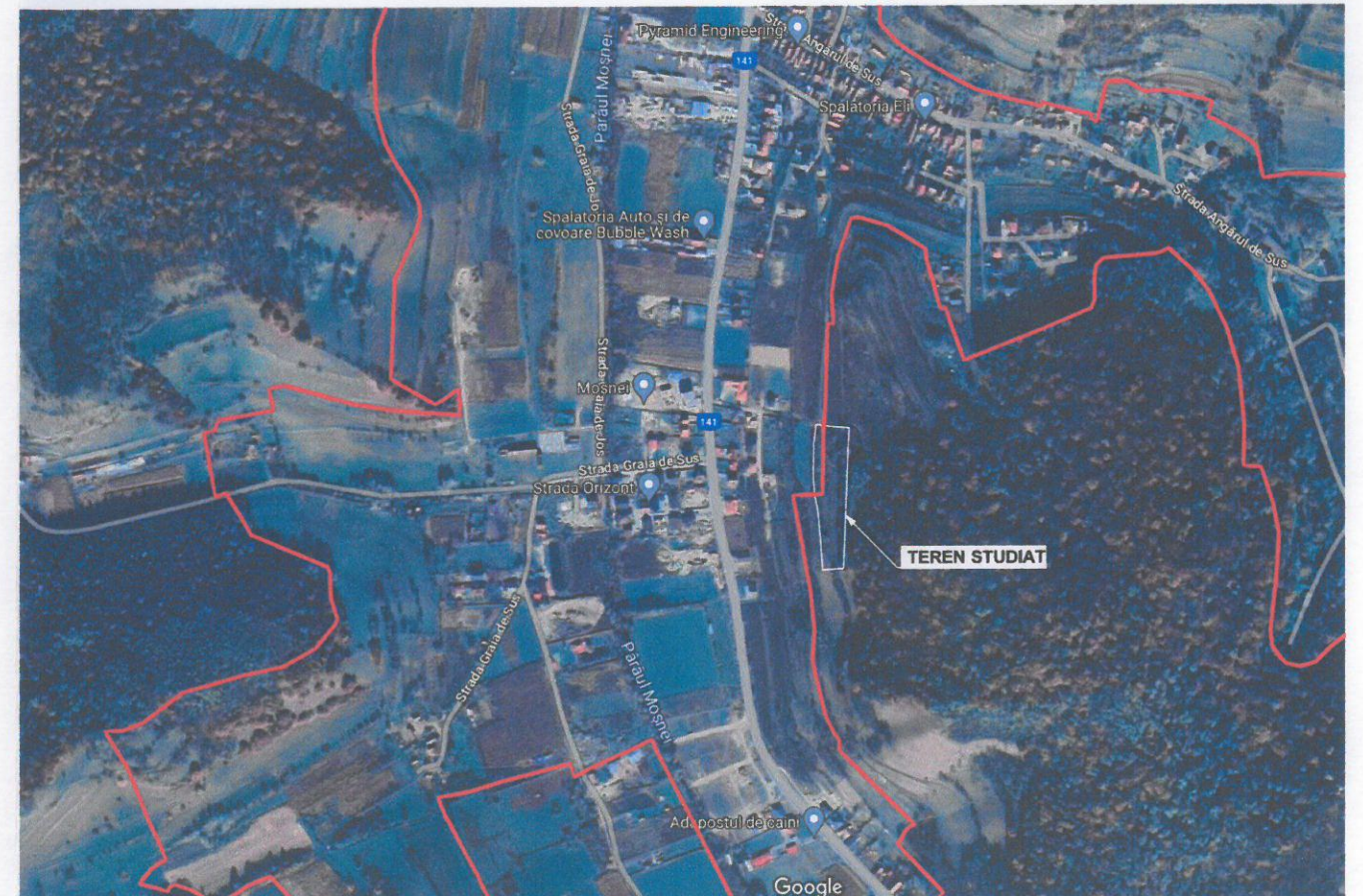
PLAN DE INCADRARE - GOOGLE MAPS 1:7 000