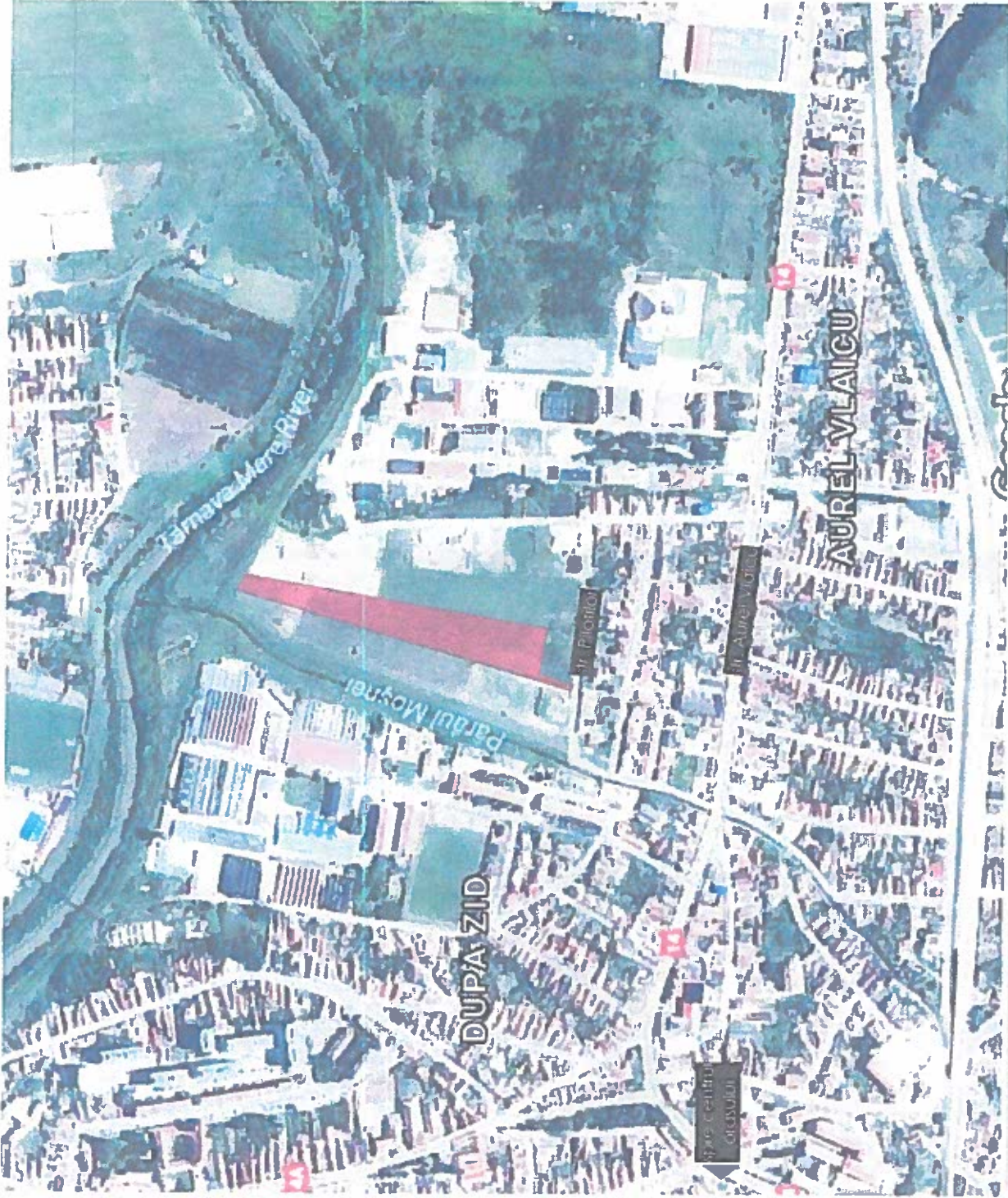
INCADRAREA IN ZONA