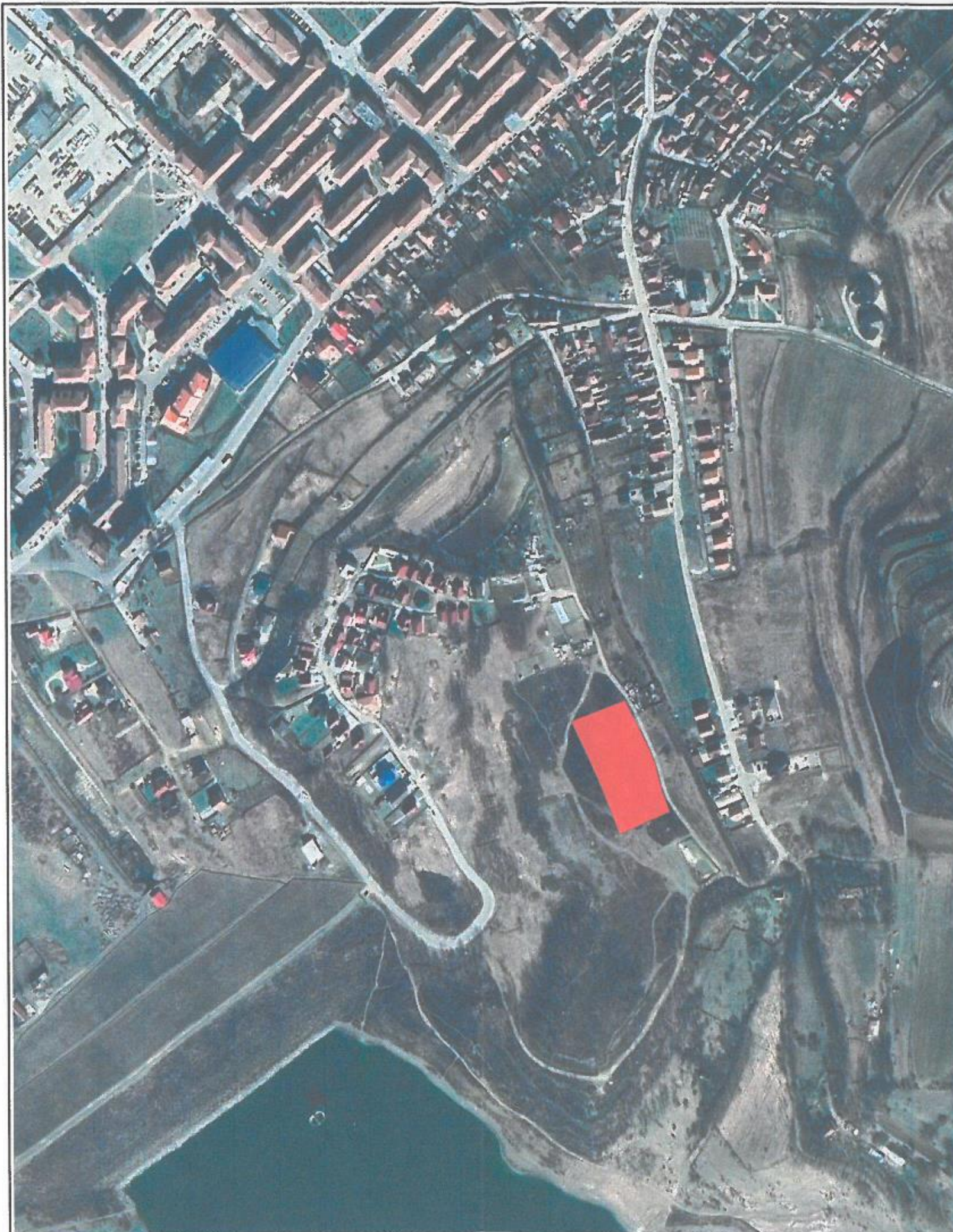
INCADRARE IN GOOGLE MAPS