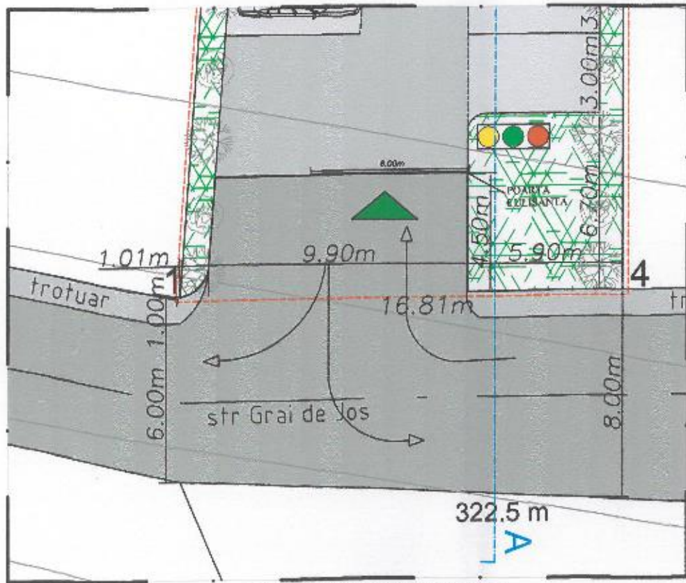
PROPUNERE AMENAJARE ACCES SC 1/200