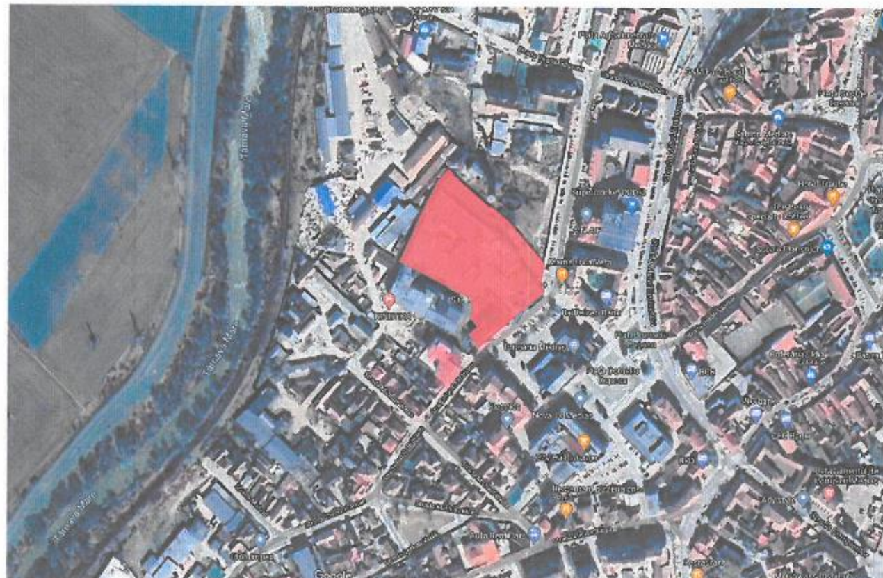
TEREN STUDIAT PLAN DE INCADRARE GOOGLE MAPS 1:5 000