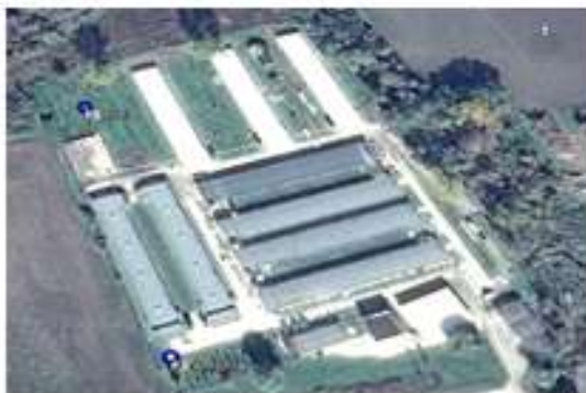
Fig. nr. 5 – Puncte de monitorizare pentru freatic

Coordonate STEREO'70 pentru punctele de monitorizare a freaticului: