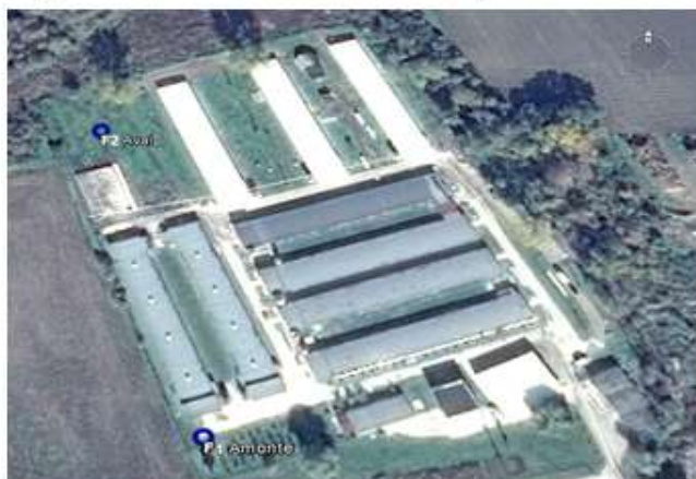
Fig. nr. 5 – Puncte de monitorizare pentru freatic

Coordonate STEREO'70 pentru punctele de monitorizare a freaticului: