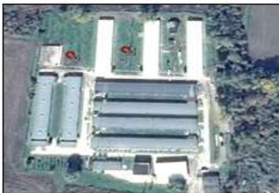
Fig. nr. 8 – Puncte de monitorizare pentru sol

Coordonate STEREO'70 pentru punctele de monitorizare ale solului: