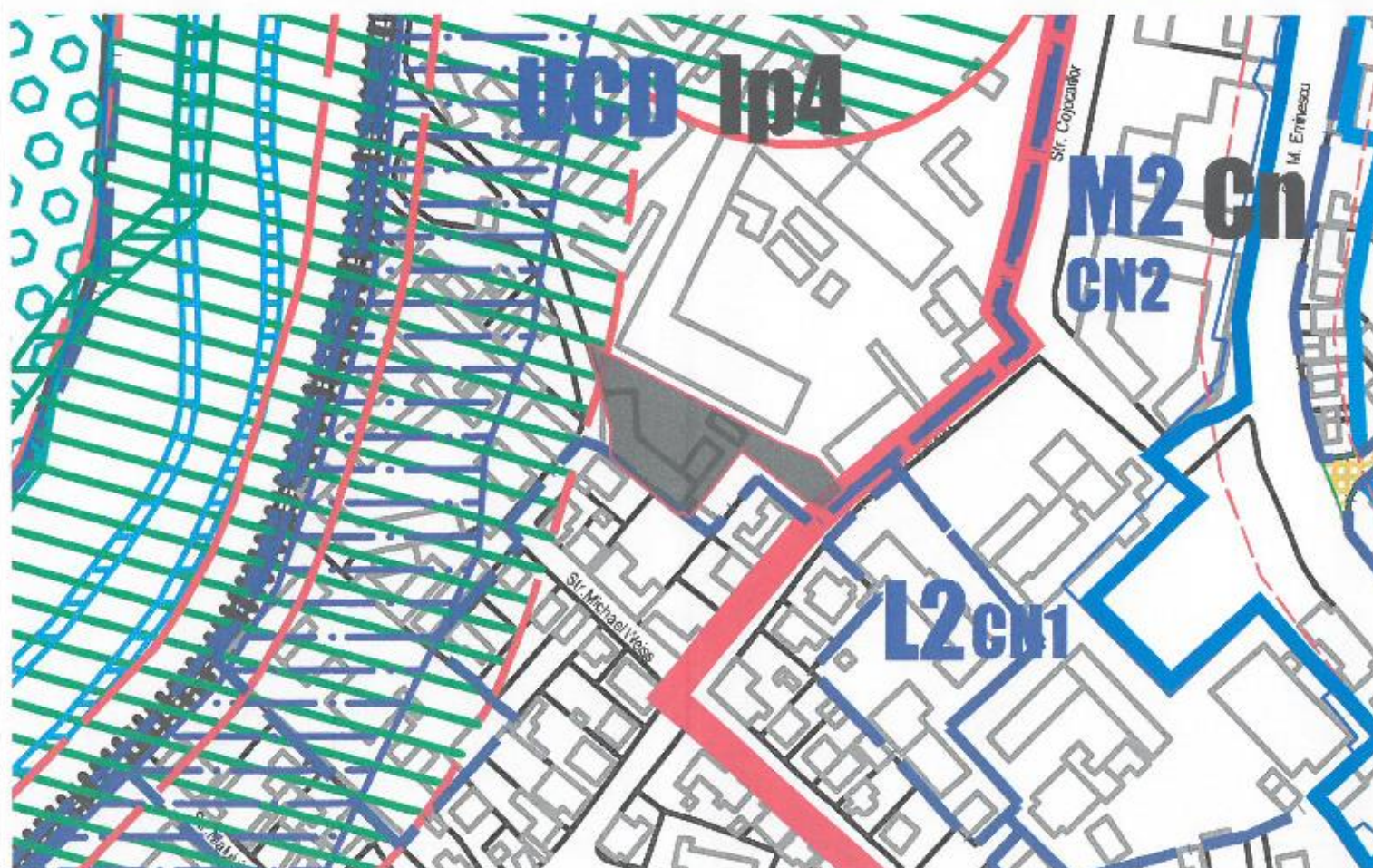
TEREN STUDIAT PLAN DE INCADRARE IN PUG 1:5 000