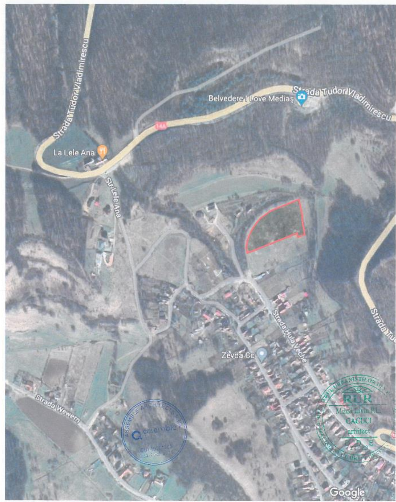
INCADRARE IN PUG - ZONIFICARE 1:5 000

Acest document este proprietatea firmei ASSEMBLE ARCHITECTS S.R.L. și nu poate fi împrumut, transmis sau reprodus, total sau parțial, fără autorizarea expresă și scrisă. Utilizarea sa trebuie să fie conformă celui pentru care a fost elaborat. Documentul este valabil numai cu semnătura și stampilele proiectanților în original.