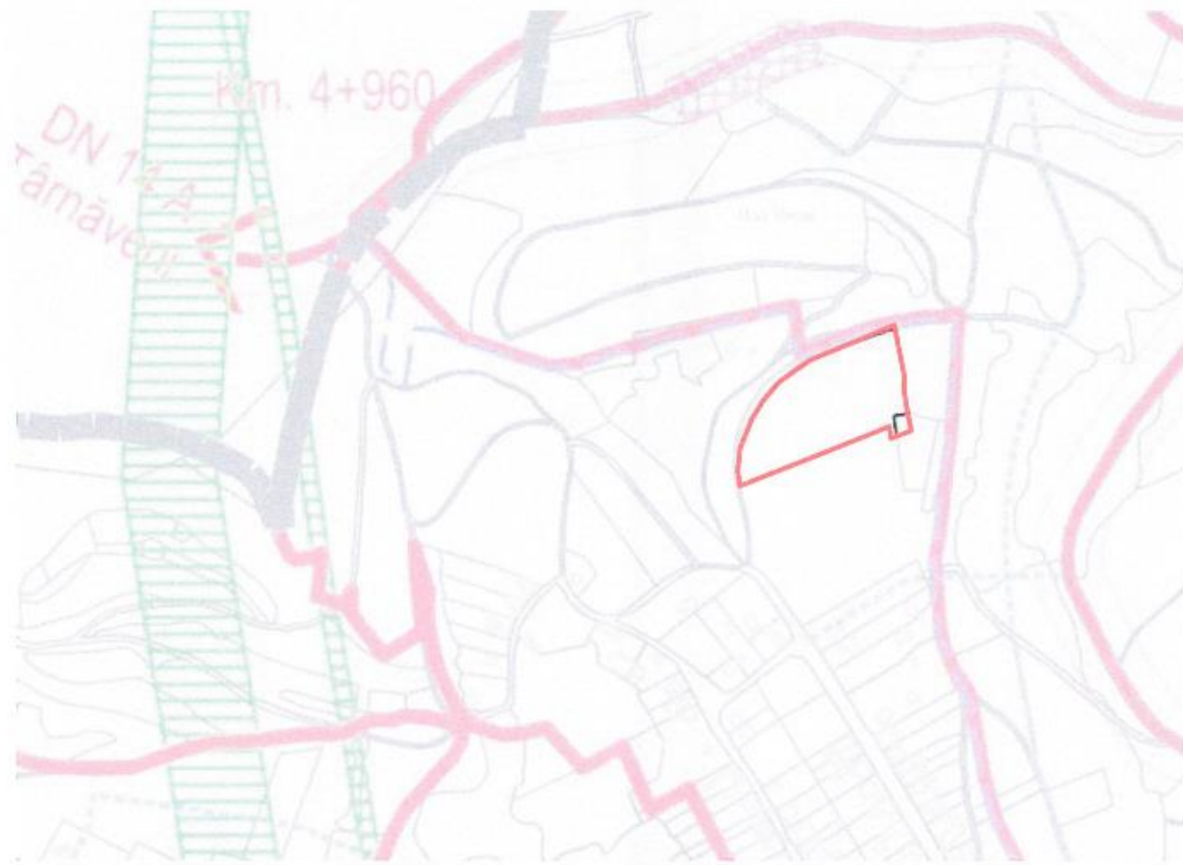
INCADRARE IN PUG - UTR 1:5 000