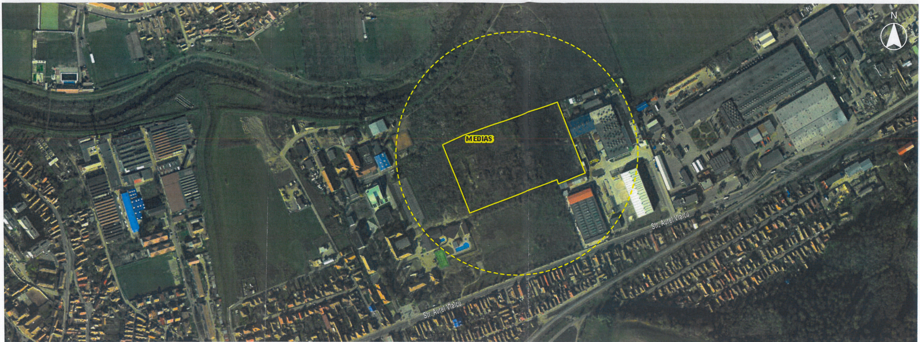
PLAN DE INCADRARE IN ZONA SC. 1: 5 000